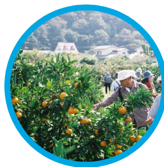
たくさんの柑橘の木