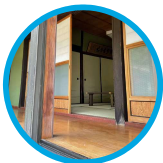
縁側で日向ぼっこ