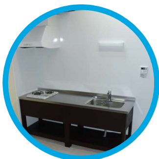
島の食材で島ゴハン作り