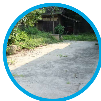
「何もしない」を楽しむ