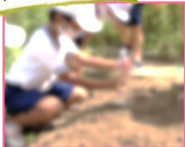
↑①畑にペットボトルの底を押しつけて、穴をほります。