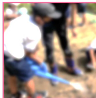
↑③土をかぶせたら、お水をたっぷりあげよう。