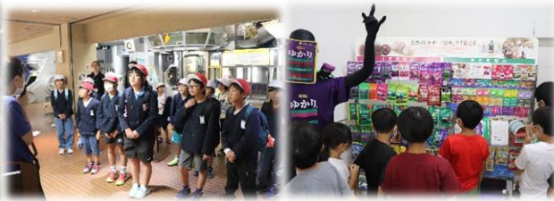
こども文化科学館

10月9日に3・4・5年生はこども文化科学館でプラネタリウムを見た後、三島食品株式会社の広島工場へ工場見学に行きました。プラネタリウムでは普段何気なく見上げている夜空の星について詳しい説明を聞き、三島食品では、あの有名なゆかりの製造過程を見学し、食品産業について学びました。