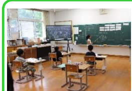
6月2日 2年生：たし算とひき算のひっ算（1）

10月6日の公開研究会に向けて、外部講師（大松恭宏先生：元江田島小学校校長）をお招きし、授業研究を行いました。児童は普段にもまして一生懸命学習に取り組んでいました。来週には、5・6年生も授業研究を行います。東野小一丸となって学習に臨む姿は素敵です！