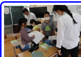
6月2日 3年生：図形を使って考えよう 6月2日 4年生：垂直・平行四辺形