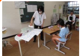
6月9日 たんぼぼ：「はこの形」（びっくりばこを作ろう！）