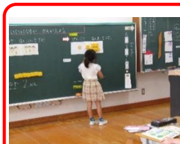
6月9日 1年生：「たしざん」