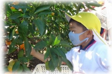
栽培体験 「みかん・レモン収穫」