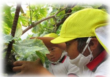
栽培体験 「ぶどう収穫」