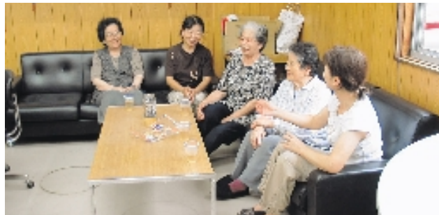
ワイワイがやがや広場

木江の天満区に交流の場が生まれました。「出かけたときに、ちょっと休むところが欲しいね」というお年寄りの声に応えました、とNPO法人かみじまの風。