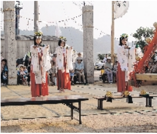
明石御串山八幡神社秋祭（9月23日） 浦安の舞を舞うのは、中学～高校生の女子。