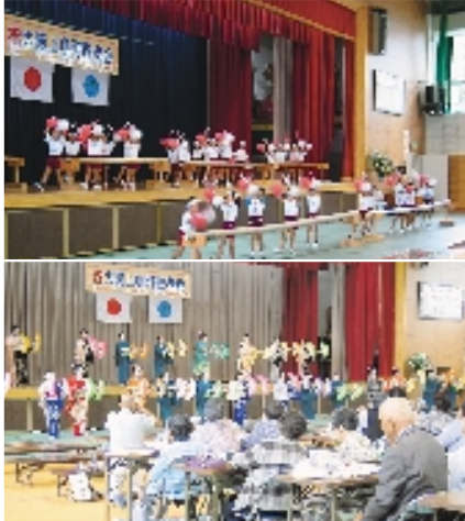
「ご長寿、おめでとうございます」の心をこめて、保育所や幼稚園園児の演技や、一般有志の銭太鼓や踊りが次々と披露されました。