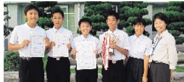
大崎中学校 団体の部 最優秀賞

9月17日に開催された豊田・竹原中学生英語暗唱大会で、町内の中学生が優秀な成績をおさめました。