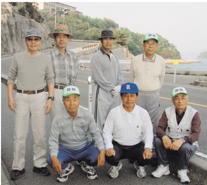
南歩こう会の皆さん

誰もが気軽に楽しくできて、メタボ対策をはじめ健康維持にも効果がある。そんな奥深い魅力を持つ「ウォーキング」に、あなたも興味が沸いてきたのではありませんか？ 普段、何気なく通り過ぎていた町の風景を眺めて歩くことは、身体だけでなく心にもきつといいはずですよ。